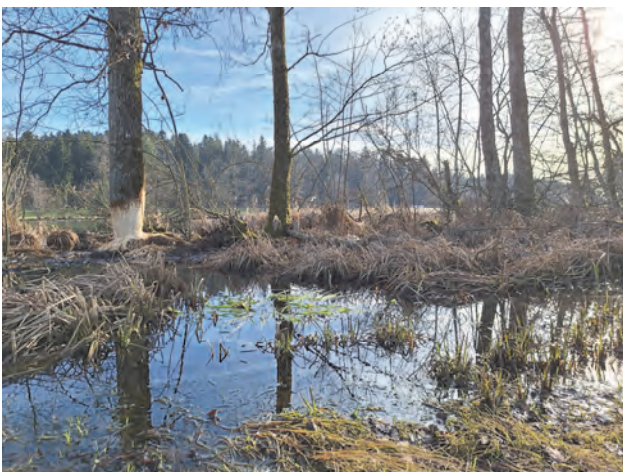
Zuviel Wasser, hier von seiner schönsten Seite am übervollenT orfseeeli Bleienbach