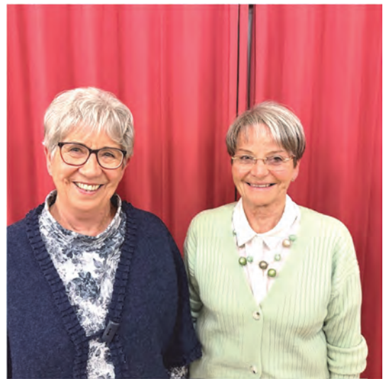
Die beiden Jubilarinnen