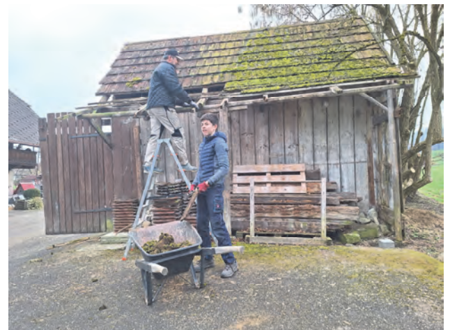
Begegnung im Flösch: Zusammen geht's leichter voran.