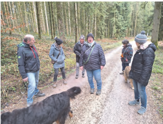
Sonntagmorgen-Begegnung im Truebbergwald