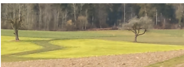
Die Perspektive macht's aus: herziger Anblick im Wyssestei