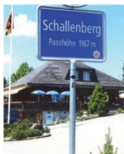
Kaffeehalt Gabelspitz, Schallenbergpass

Einladung zur Kulturreise am Samstag, 16. Sept. 2023