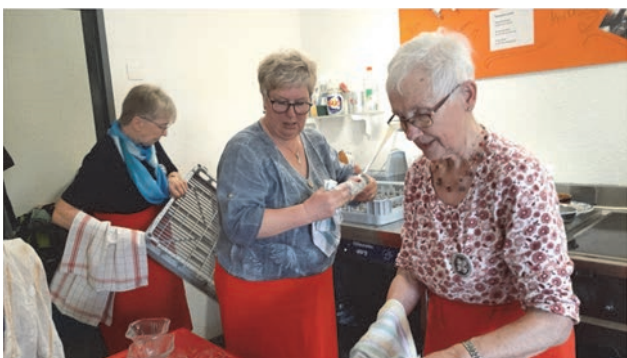
Grosseinsatz Hand in Hand auch im Pöschli beim Abwasch.....