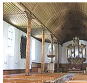
Führung in der St. Michaels-Kirche in Meiringen

Abfahrt: 07.05 Uhr Bahnhof Lotzwil (Ankunft von: Langenthal: 06.54, Huttwil: 07.02) 07.10 Uhr Berggarage, Rüttschelen 07.15 Uhr Gemeindehaus, Rüttschelen 07.20 Uhr Wil, Rüttschelen