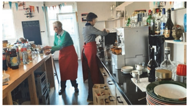
.... und beim Getränke-Ausschank