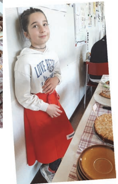
‚Unsere‘ jüngste Mitarbeiterin am Kuchenbuffet