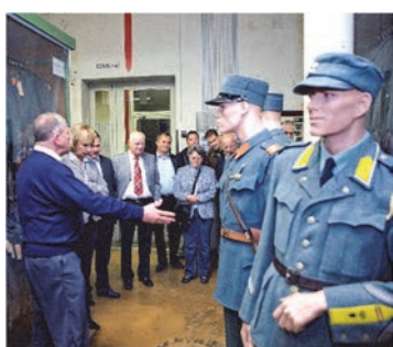
Führung Stiftung HAM, Thun ("Armeemuseum")