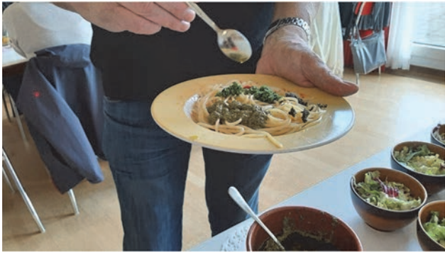
Die Saucen waren erstklassig....