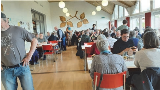
...die Gäste mehr als zufrieden