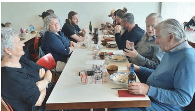
Uns freute auch, dank ‚Regionalfenster‘ Gäste aus Langenthal zu sehen.