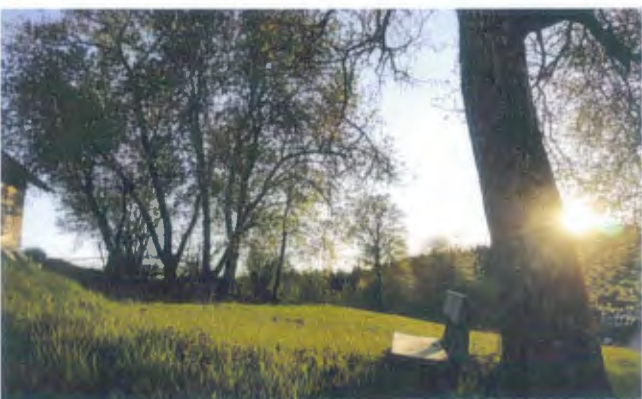
Zauberhafte Abendstimmung bei Kasers