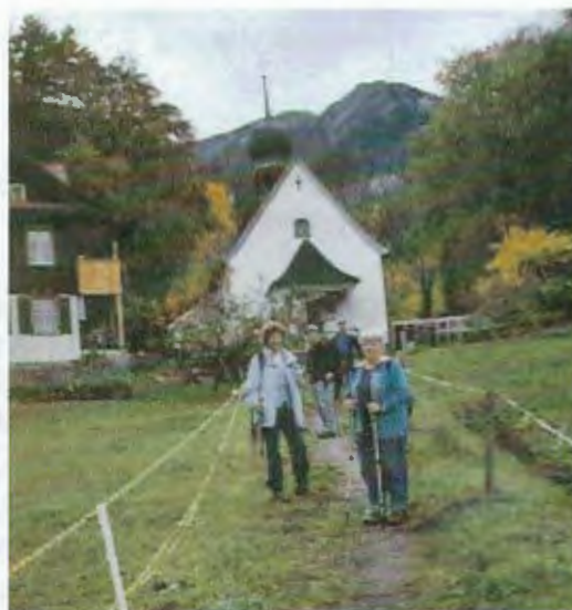
Aufstieg nach St. Niklausen