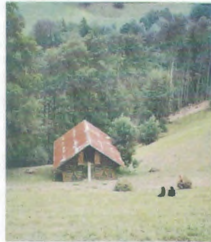
Mühsam hat dieser Landwirt das Emd eingetan.

Um halb 10 marschieren wir von Giswil aus Richtung Sarnersee, dem Ufer entlang bis Sachseln. Nach Sachseln geht's steil den Berg hinauf. Die Lunge wird gefordert. Der Ausblick ist herrlich, das Wetter so la la. Seit Giswil hat sich noch eine Frau zu uns gesellt. In Flüeli essen wir um 13 Uhr die Cervelats – wieder kalt, denn der Fussmarsch nach Kerns ist noch weit. Ein Besuch in der Einsiedelei Ranft lohnt sich. Aber es erwartet uns wieder ein steiler Aufstieg nach St. Niklausen. Wir wandern statt über St. Antoni direkt nach Kerns, denn die Müdigkeit macht sich bemerkbar. Wir gehen noch die fürchterlich hohe Brücke schauen. Um 16.15 Uhr Ankunft in Kerns.