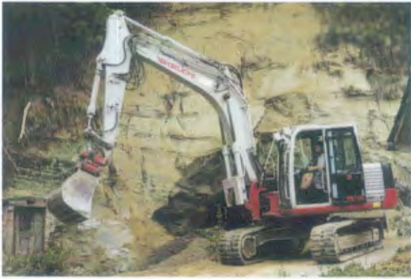
Immer wieder brach Sandstein ab und die Hohle rauf zum Hubel musste gesperrt werden. Jetzt wurde der Fels gesäubert und dürfte wieder sicher sein.