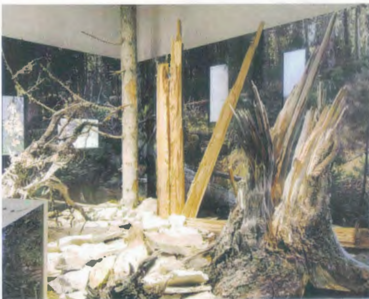
Am zweiten Tag zurück nach Zernez zum Besuch im Nationalparkmuseum - Fahrt durchs Engadin mit Aufenthalt in St. Moriz. Weiter über den Julierpass nach Sargans zum Zvierihalt. Dann nach Hause.