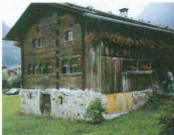
Geburtshaus von Bruder Klaus