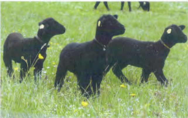
...andere halten dafür Vierbeiner. Diesen neugierigen kleinen Wollspendern konnte man im Flösch begegnen.