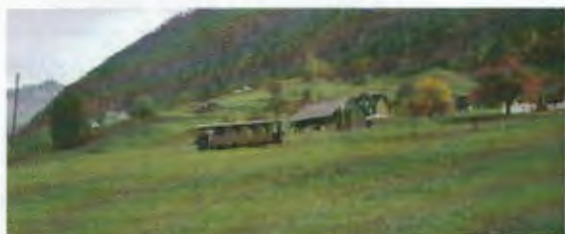
Bähnli zum Stanserhorn

Wäge de Unwätter im Ouguscht hei mir äs paar Wuche Pouse gmacht. Hüt isch es ändlech wieder sowit. Am haubi 10 loufe