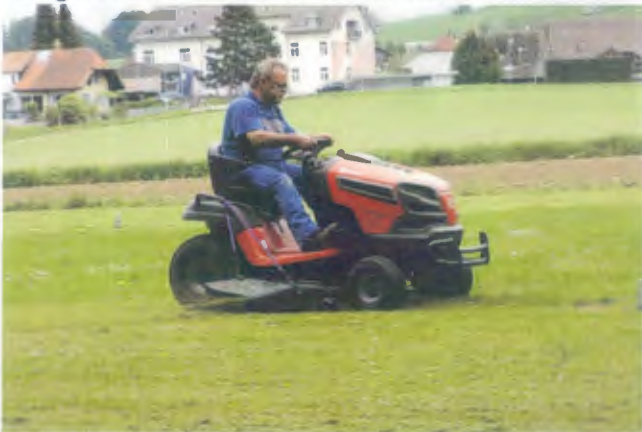
Die einen pflegen ihre Grünflächen motorisiert...