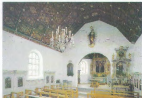
Kapelle von Flüeli Ranft