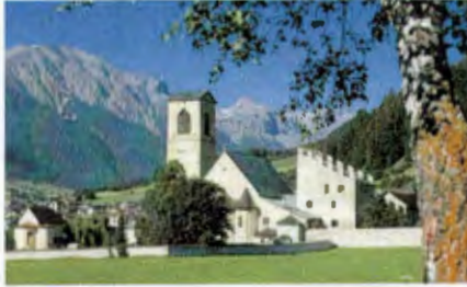
Val Müstair (GR) Kloster St. Johann