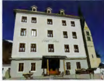
Hotel Stelvio, Sta. Maria