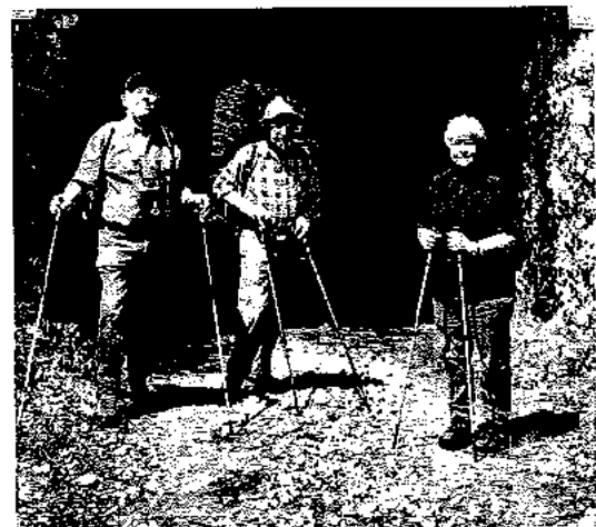
Vor em Hegeloch